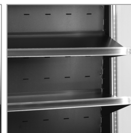
Estantes ajustables con función inclinación