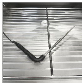
Sonda de núcleo incluida